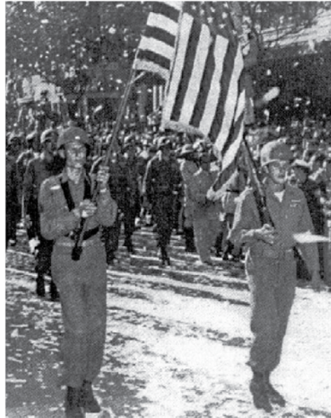
Soldados americanos marcham junto com os brasileiros no desfile de regresso da FEB, em julho de 1945

1. ANALISE o contexto em que foram produzidas essas duas imagens.